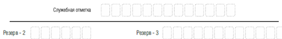
Рис. 5. Поля для служебного использования

Поля для служебного использования «Служебная отметка», «Резерв-2» и «Резерв-3» не заполняются.