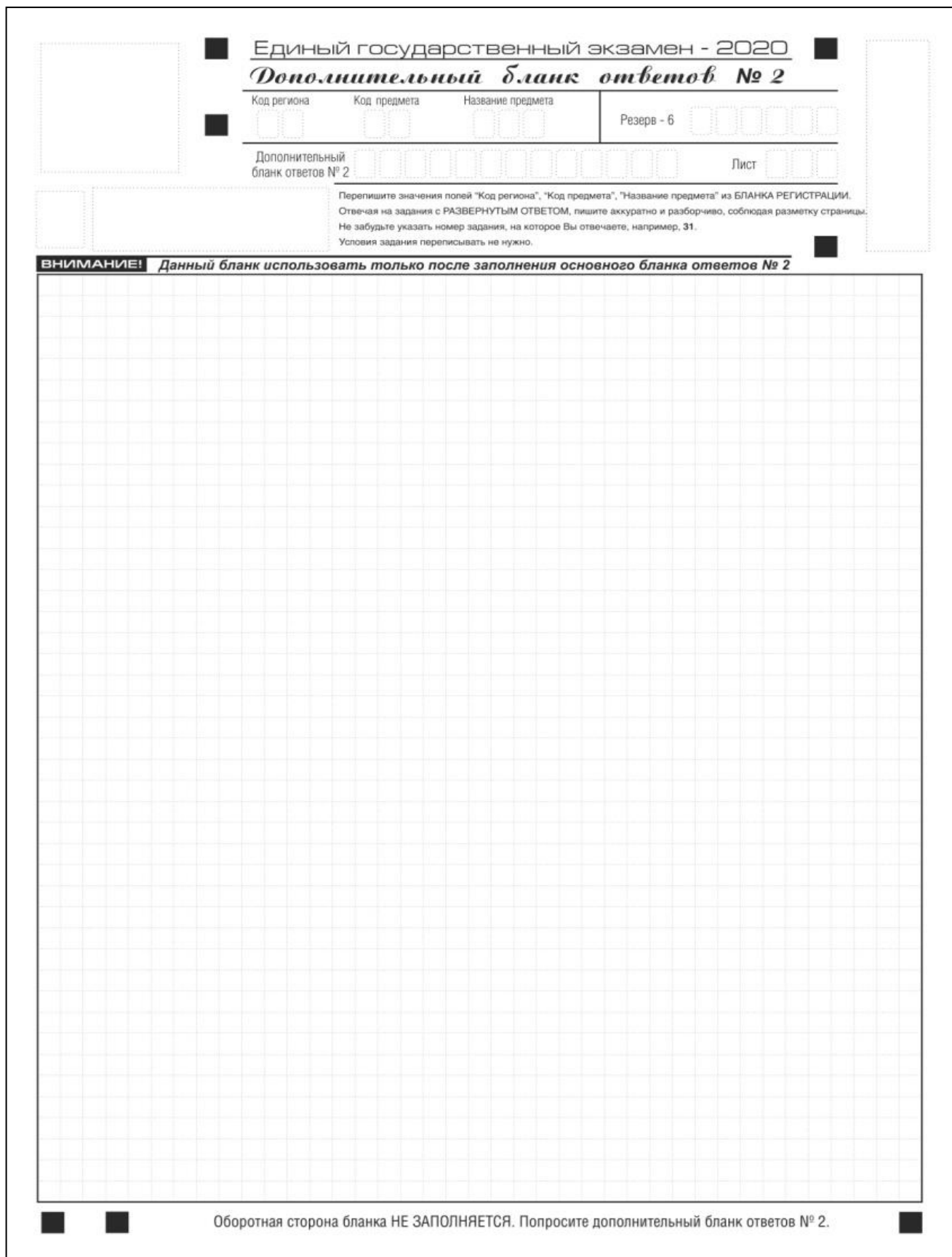
Рис. 16. Дополнительный бланк ответов № 2 по китайскому языку