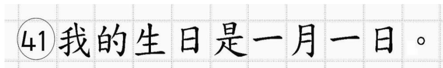
Рис.14. Образец написания иероглифических знаков

отдельной клетки области ответов бланка ответов №2 (дополнительного бланка ответов №2) (рис. 14).